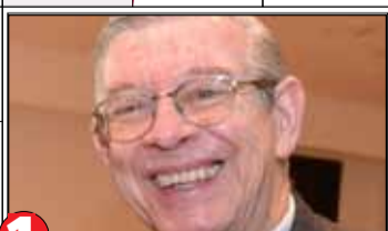
1 Concejal progresista, defensor de la obra de Petro, ingeniero civil vinculado al movimiento obrero desde los años 70, combativo luchador por el trabajo decente.